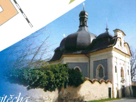
Kostel sv. Vojtěcha