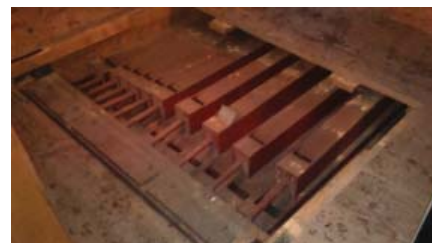
Co se skrývá pod podlahou na kůru

Varhany jsou nástroj dechový, co se člověk ještě nedoví. Nepohání se však dechem, ale velkým měchem. Kdo chce na ně hrát, musí dlouho studovat.