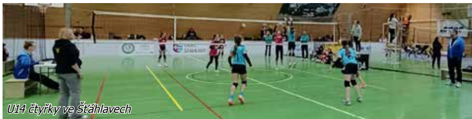
U14 čtyřky ve Štáhlavech

hé výkonnostní skupině, zlepšuje se jak pohyb a spolupráce na hřišti, tak technika. To samé platí i o starší trojici, která remízovala se všemi soupeři a upevnila si své místo ve druhé výkonnostní skupině, kam po minulém kole postoupila. V neděli jsme pak na domácí půdě byly svědky velmi vyrovnaného sestrovražděného derby družstva Štáhlavy A a Štáhlavy B. Áčkové čtveřici se nakonec přes jednu prohru