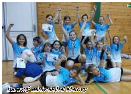
Barevný minivolejbal Klatovy