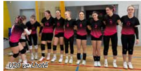
U20 ve Lhotě

družstvo U15 si dvěma výhrami upevnilo své postavení v nejvyšší skupině a drží se v průběžné tabulce na krásném druhém místě za týmem Lhota A, se kterým v tiebreaku utrpělo svou jedinou prohru. Družstvo U14 si svým bojovným výkonem připsalo dvě výhry a dvě těsné prohry. Stejnou nedělí vyrazily naše nejzkušenější hráčky do Lhoty pokusit se postoupit v kategorii U20 do vyšší skupiny, což se bohužel tentokrát nepovedlo, přestože dvě ze tří bitev byly vítězné.