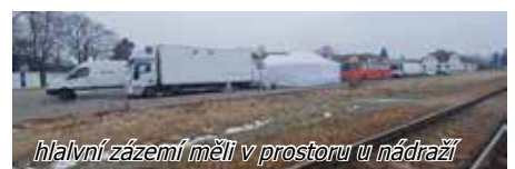
hlavní zázemí měli v prostoru u nádraží