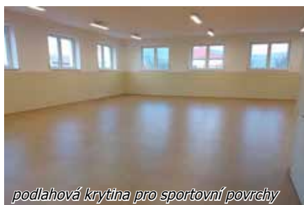
podlahová krytina pro sportovní povrchy

Především rozcvičovnu o ploše 160 m2, technickou místnost, hlavní chodbu a dále 6 šaten se sociálním zázemím. Přitom vždy 2 sousedící šatny jsou propojitelné dveřmi a mají společnou průchozí umývárnu se 3 sprchami a 2 umyvadly a dále místnost s 2 samostatnými WC, 3 umyvadly a 4 pisoáry.