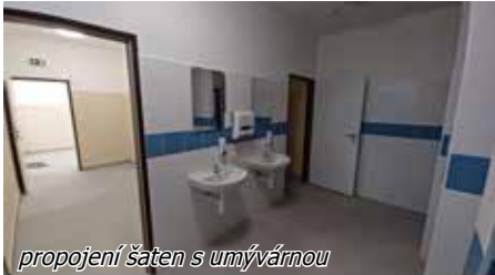
propojení šatny s umývárnu

řídící jednotku pro splachování záchodů dešťovou vodou, rack (rozvaděč pro datové sítě), 2 hasicí přístroje a také vstup do střešního prostoru.